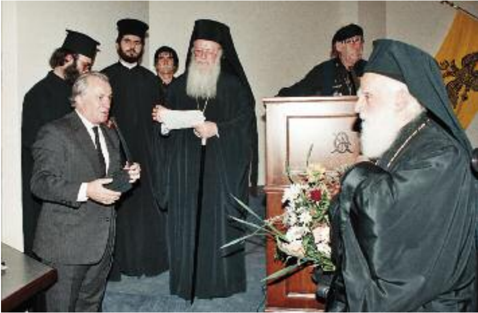
Όμιλία τοῦ Πατριάρχου