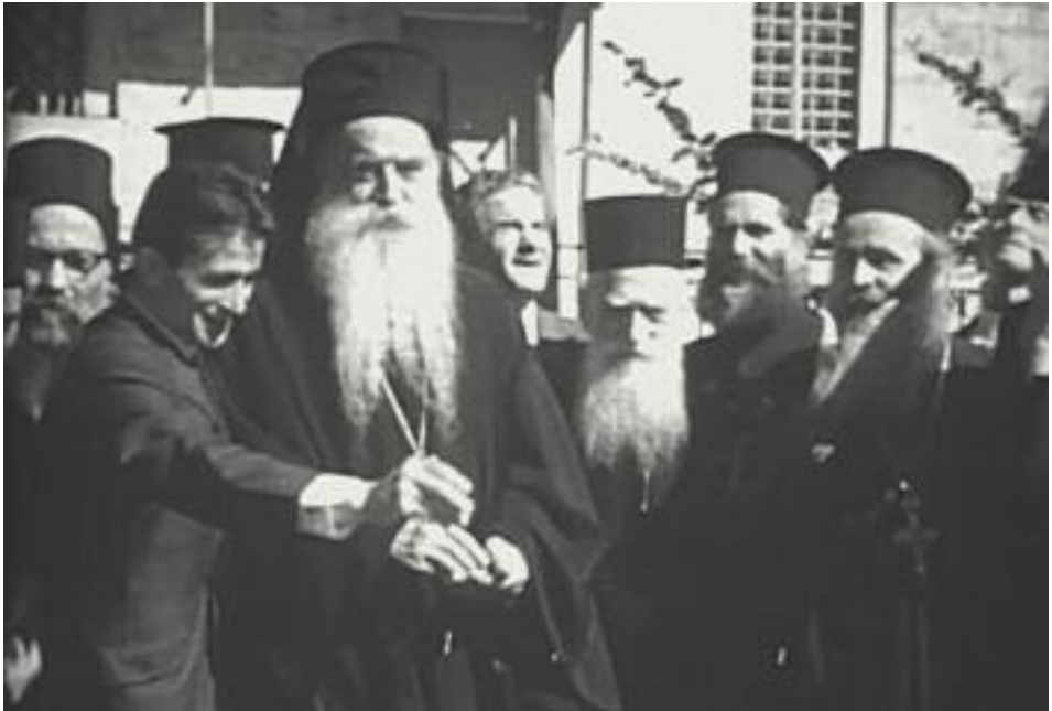
Μέ τόν Άθηναγόρα στή ΜΕΓΑΛΗ ΛΑΥΡΑ του Άγίου Όρους