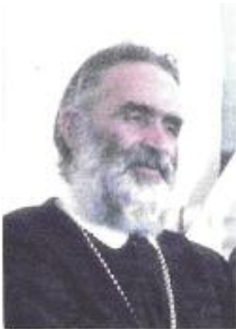
Μητροπολίτης Κισιάμου και Σελίνου Εἰρηναῖος

Στό Ἄρθρο 1 ὀρίσαμε ὅτι τό Ἰδρυμα «τίθεται ὑπό τήν πνευματικήν προστασίαν τῆς Α.Θ.Π. τοῦ Οἰκουμενικοῦ Πατριάρχου, τοῦ ὁποῖου τό ὄνομα μνημονεύεται καθ' ἐκάστην ἐν τῷ Ἰδρύματι λατρευτικήν πράξιν» . Στό ἄρθρο 12 ὀρίσαμε τά τῆς Συνάξεως τῶν Ἐταίρων τῆς Ἀκαδημίας, ἡ ὁποία ἀποτελεῖ «Ὄργανον ἀνωτάτης πνευματικῆς κηδεμονίας τοῦ Ἰδρύματος» . Τῆς Συνάξεως προΐσταται ἡ Κοσμητεία, τόν Πρόεδρον τῆς ὁποίας ὀρίζει ἡ Α.Θ.Π. ὁ Οἰκουμενικός Πατριάρχης, ὡς ἐκπρόσωπον αὐτοῦ. Στό ἄρθρον 20, τέλος,