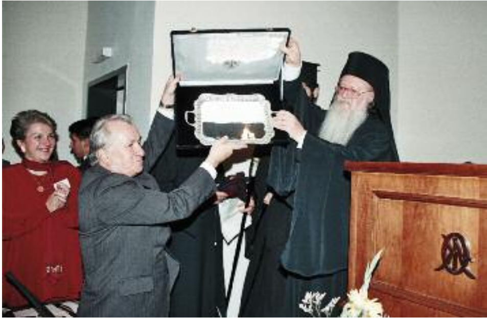
Άσημένιος Δίσκος με ύπογραφή τοῦ Πατριάρχου