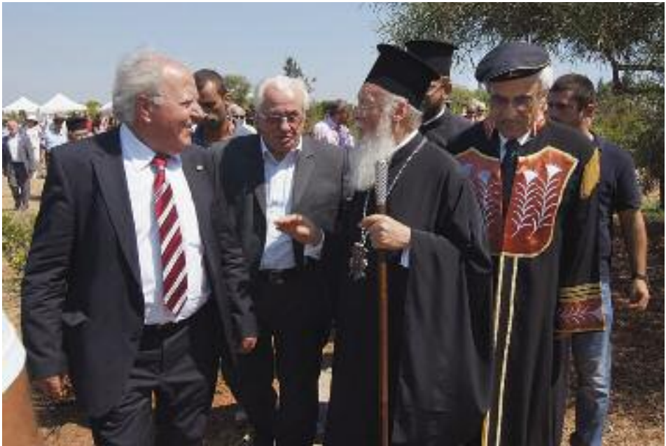
Ὁ Πρύτανης καὶ ὁ Πατριάρχης