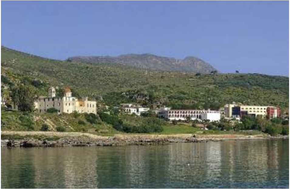
Ίερά Μονή Γωνιάς και Όρθόδοξος Ακαδημία Κρήτης