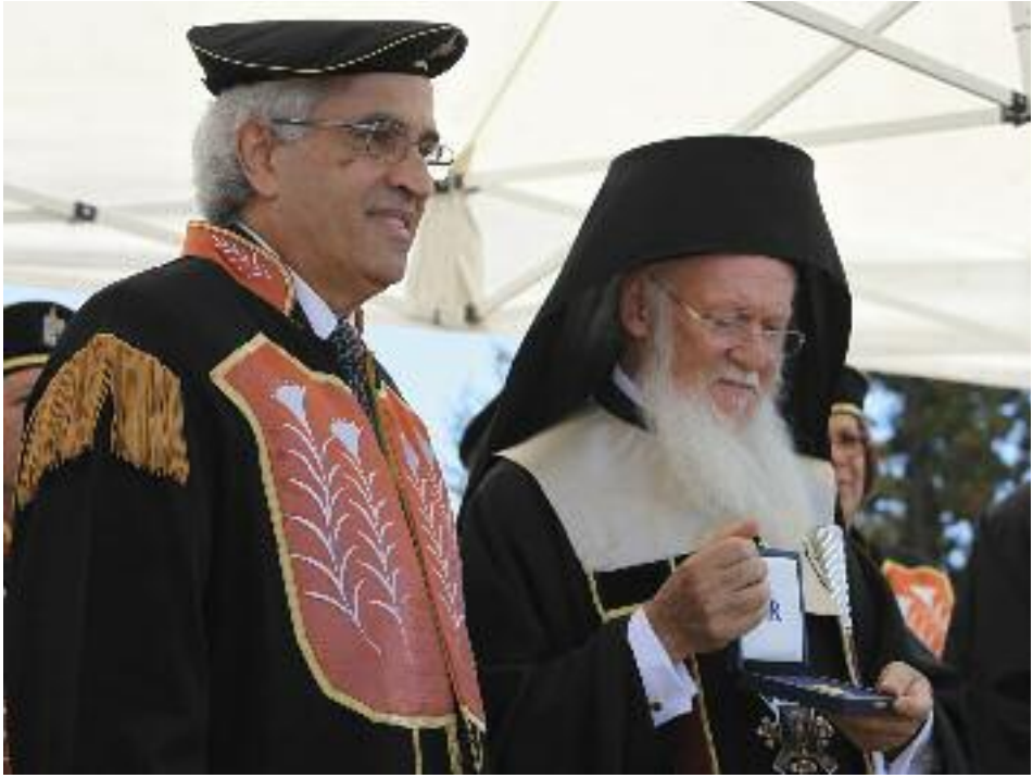
Ὁ Πρύτανης καὶ ὁ Πατριάρχης