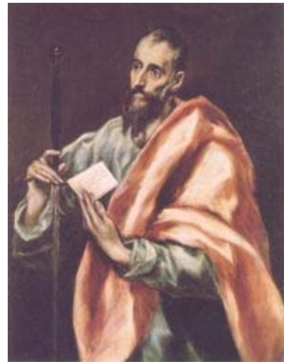
Ο Απόστολος Παύλος