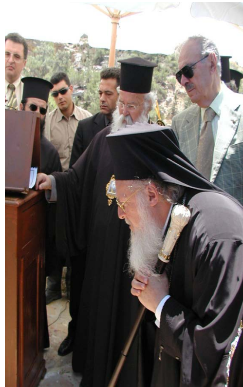
Ο Πατριάρχης αποκαλύπτει και παρατηρεί τη στήλη