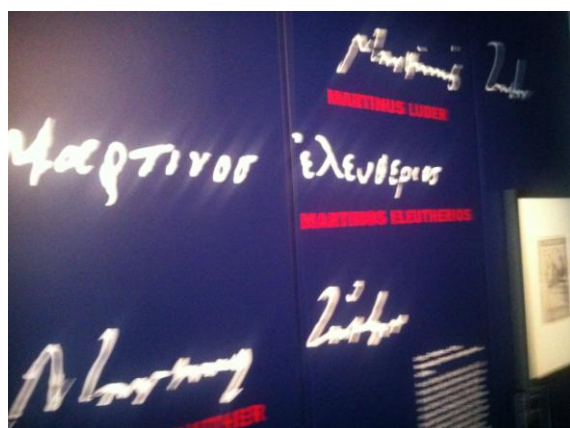
Επιγραφή στο σπίτι που γεννήθηκε ο Λούθηρος, στην πόλη Eisleben

Η επισήμανση: Ο ως άνω Μεταρρυθμιστής είναι γνωστός ως Μάρτιν Λούθηρος. Το όνομα Martin έλαβε κατά τη βάπτισή του στις 11 Νοεμβρίου 1483, εορτή του Αγίου Martin. Ελάχιστα γνωστό, ακόμη και σε Γερμανούς θεολόγους, αλλά και σε μας είναι αυτό, για το οποίο γράφεται το παρόν σημείωμα: Ότι δηλαδή εκτός από το Martin, ο Λούθηρος είχε επιλέξει αργότερα για τον εαυτό του και το όνομα Ελευθέριος (Eleutherios και όχι το εκλατινισμένο Eleutherius). Απαντάται μάλιστα εξελληνισμός και του άλλου ονόματός του: Martinus .