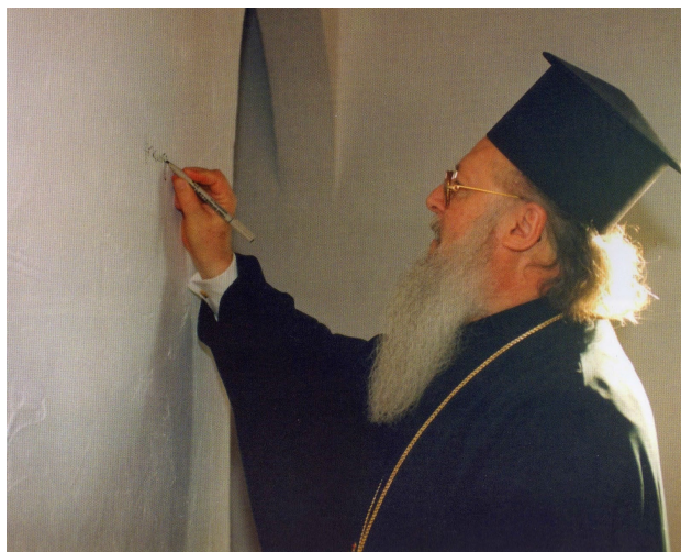
Ο Οικουμενικός Πατριάρχης Βαρθολομαίος υπογράφει στον τοίχο του γραφείου του Αμερικανού συγγραφέα Robert Fulghum, στον χώρο της Ακαδημίας.

Δύο χρόνια προ των εγκαινίων της ΟΑΚ και σε μέρες που δεν είχε ακόμη εξομαλυνθεί η τραχεία οδός, επί της οποίας βάδιζαν γέροντας και τεκνίον, ο Ειρηναίος, σε γράμμα του προς την Αλέξανδρο, έλεγε: «Δεν γνωρίζουμε τι έχει γράψει ο Θεός στην απέραντη δωρεά της χάριτός Του για μένα και για σένα και για τη συνεργασία μας. Μπορούμε μόνο να είμαστε πάντοτε έτοιμοι και άξιοι και να προχωρούμε κάτω από το φως και το κραταιό χέρι Του» (Ε. προς Α., 23.9.1966). Οι τέσσερεις και πλέον γόνιμες και παραγωγικές δεκαετίες που ακολούθησαν στη Γωνιά, φανέρωσαν ότι όντως «ην χειρ Κυρίου μετ' αυτών» (Πρ.11,21).