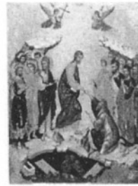
Στο εξώφυλλο: Η εις Άδου Κάθοδος, Φο- ρητή εικόνα της Κρητικής Τέχνης του 15 ου αιώνα.