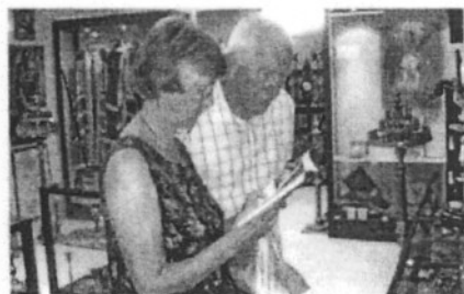
Ξένοι επισκέπτες μελετούν τα εκθέματα του Μουσείου