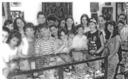
Στιγμιότυπο από την επίσκεψη Δημ. Σχολείου στο Μουσείο