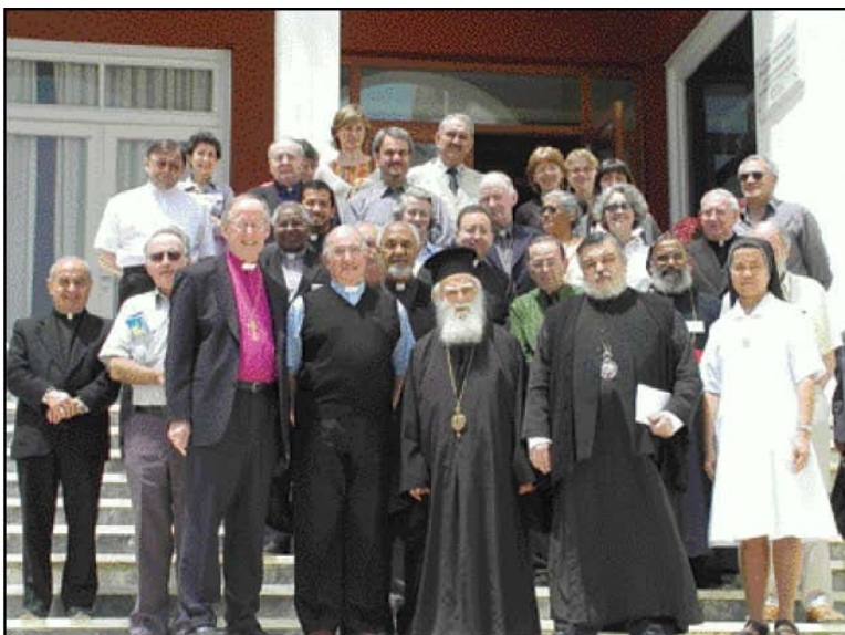
Ο Πρόεδρος της ΟΑΚ Σεβασμ. Ειρηναίος με τα μέλη της Μεικτής Επιτροπής Θεολογικού Διαλόγου Ρωμαιοκαθολικής Εκκλησίας και Παγκοσμίου Συμβουλίου Εκκλησιών.