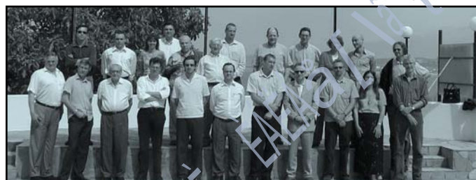
Τα μέλη του συνεδρίου

Ι διαίτερα σημαντικό διεθνές συνέδριο ειδικών, που ασχολήθηκαν με την πολιτική που επιβάλλεται να εφαρμοσθεί διεθνώς, προς αποτελεσματική αντιμετώπιση του προβλήματος των ναρκωτικών. Τη συντο-