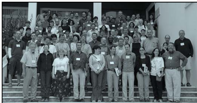
Τα μέλη του συνεδρίου

Το όνομα της ορμόνης προέρχεται από το ελληνικό ρήμα αυξάνω. Όλα τα φυτά παράγουν αυξίνη. Η αυξίνη είναι μια πολύ απλή οργανική ουσία. Όμως αυτό το απλό μόριο έχει σημαντικά αποτελέσματα στα φυτά. Η ορμόνη αυτή προκαλεί αύξηση του όγκου των φυτικών κυττάρων. Τα φυτά δεν μεγαλώνουν χωρίς αυξίνη. Αυταπόδεικτο είναι λοιπόν, ότι η αυξίνη είναι πολύ σημαντική για τη γεωργία, δένδροκομία και δασολογία. Τα πεύκα χρειάζονται αυξίνη για να σχηματίσουν ξύλο. Κομμάτια κλαδιών δεν μπορούν να παράγουν ρίζες χωρίς την αυξίνη. Κατανοώντας το πώς η αυξίνη προκαλεί τα αποτελέσματά της, θα μπορούμε να παράγουμε καλύτερη ποιότητα ξύλου. Η γνώση αυτή θα επιτρέψει επίσης την παραγωγή περισσότερων και με υψηλότερη ποιότητα αγροτικών προϊόντων. Αυτό είναι αναγκαίο, καθώς μεγαλώνει η ζήτηση