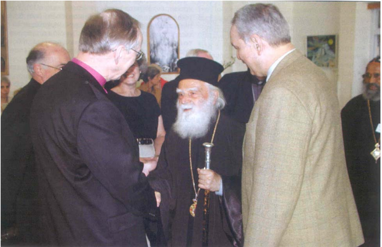
Ο Σεβασμ. Ειρηναίος με τον Λουθηρανό Επίσκοπο Jonas Jonson και τον Γ. Λαιμόπουλον .