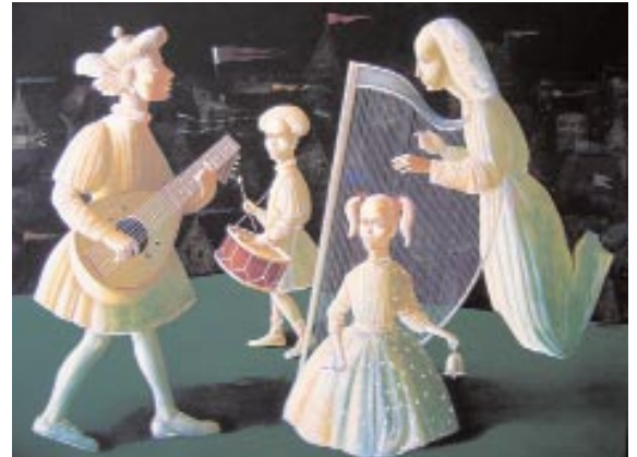
Εργο του Vahram Davtian («Λευκή Συμφωνία - Προσευχή για παραμυθία»)

(Περί τῶν τριῶν ἱερατικῶν τῆς Ἐκκλησίας βαθμῶν, ἐπιστολιμαία διατριβή, ὑπὸ τοῦ Πρεσβυτέρου καὶ Οἰκονόμου Κωνσταντίνου τοῦ ἐξ Οἰκονόμων, Ἐν Ναυπλίᾳ Α,ΩΛΕ, σελ. 337-339).