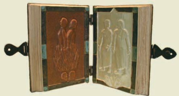
Έργο του Arnold Klaus από το Πρόγραμμα της ΟΑΚ «Πρόσωπον προς Πρόσωπον»