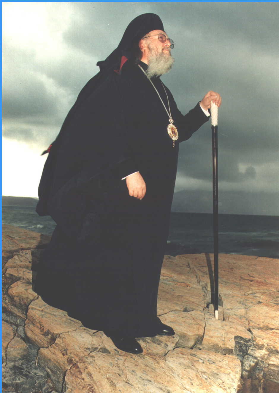
The Ecumenical Patriarch Bartholomaios planted an olive tree in the EYC, 1992