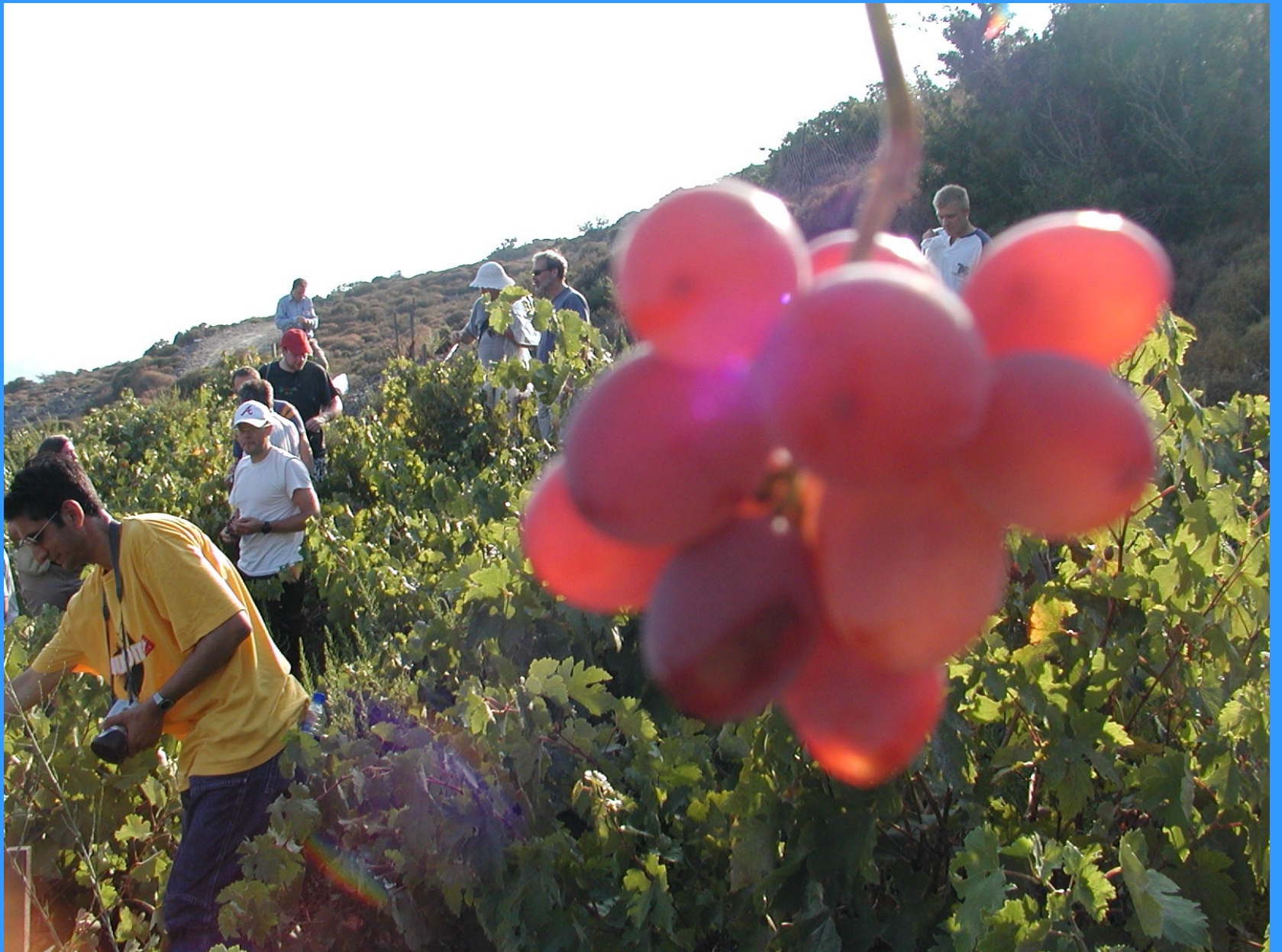
At the vineyard of the EYC